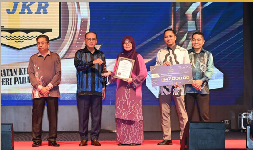
JKR Pahang Rangkul Pingat Emas di Anugerah Pahang 1st (APF) 2023