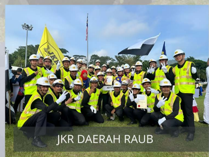
JKR DAERAH RAUB