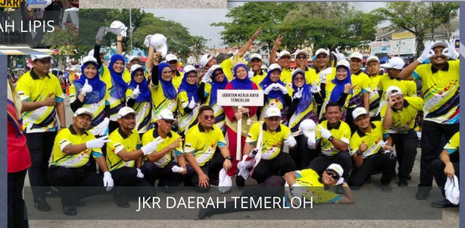
JKR DAERAH TEMERLOH