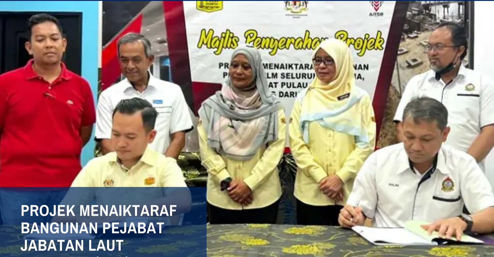
PROJEK MENAIKTARAF BANGUNAN PEJABAT JABATAN LAUT MALAYSIA (JLM) SELURUH MALAYSIA - PEJABAT LAUT PULAU TIOMAN, ROMPIN, PAHANG - 10/08/2023