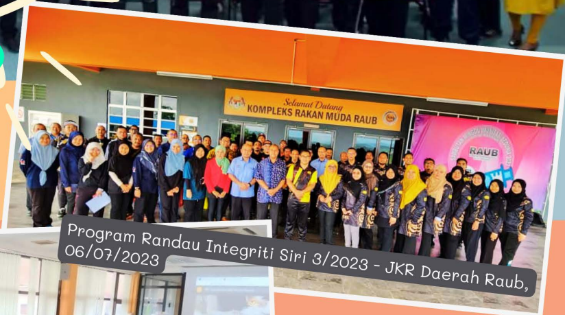
Program Randau Integriti Siri 3/2023 - JKR Daerah Raub, 06/07/2023