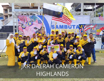
JKR DAERAH CAMERON HIGHLANDS