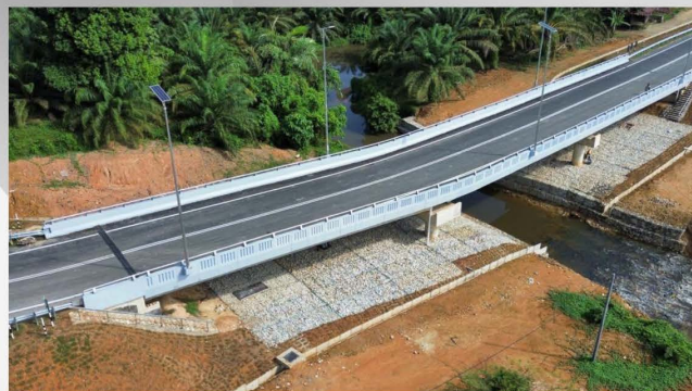
Projek Membina Baru Jambatan Konkrit Di C115 Seksyen 8.6 Kg.Jergoh, Temerloh - 03/11/2023