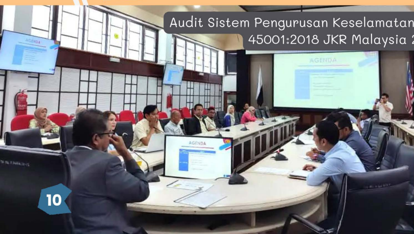
Audit Sistem Pengurusan Keselamatan dan Kesihatan Pekerjaan (SPKKP) MS ISO 45001:2018 JKR Malaysia 2023, 14/08/2023 - 16/08/2023