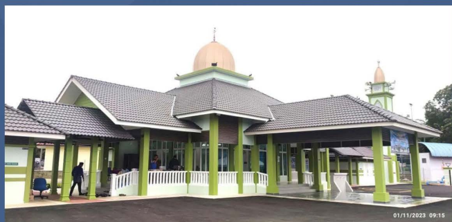
Projek Pembinaan Baru Masjid Kampung Durian Hijau, Jerantut, Pahang - 01/11/2023