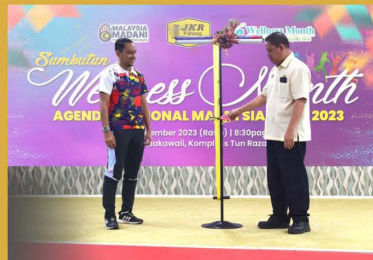
Sambutan Wellness Month 2023 Peringkat JKR Negeri Pahang