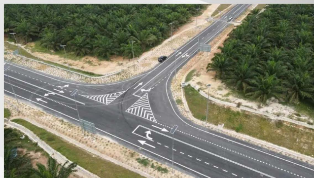
Projek Membina Jalan Baru Di Bandar 34, Bera, Pahang (Fasa 1) - 03/11/2023