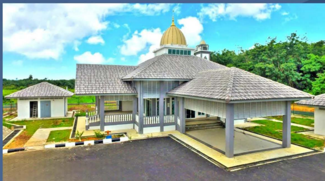
Projek Membina Baru Masjid Kampung Kuala Tekal, Kuala Krau, Temerloh, Pahang - 16/11/2023