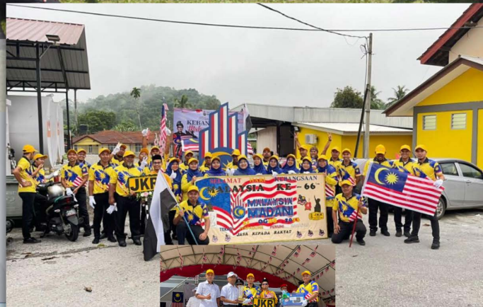
JKR DAERAH LIPIS