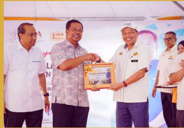
Majlis Penyerahan Projek Menaiktaraf Jalan Laluan 64 Jalan Benta - Jerantut - Maran (Fasa 1 Segmen 7)