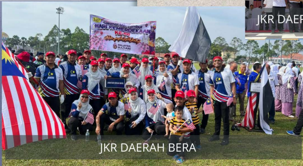
JKR DAERAH BERA