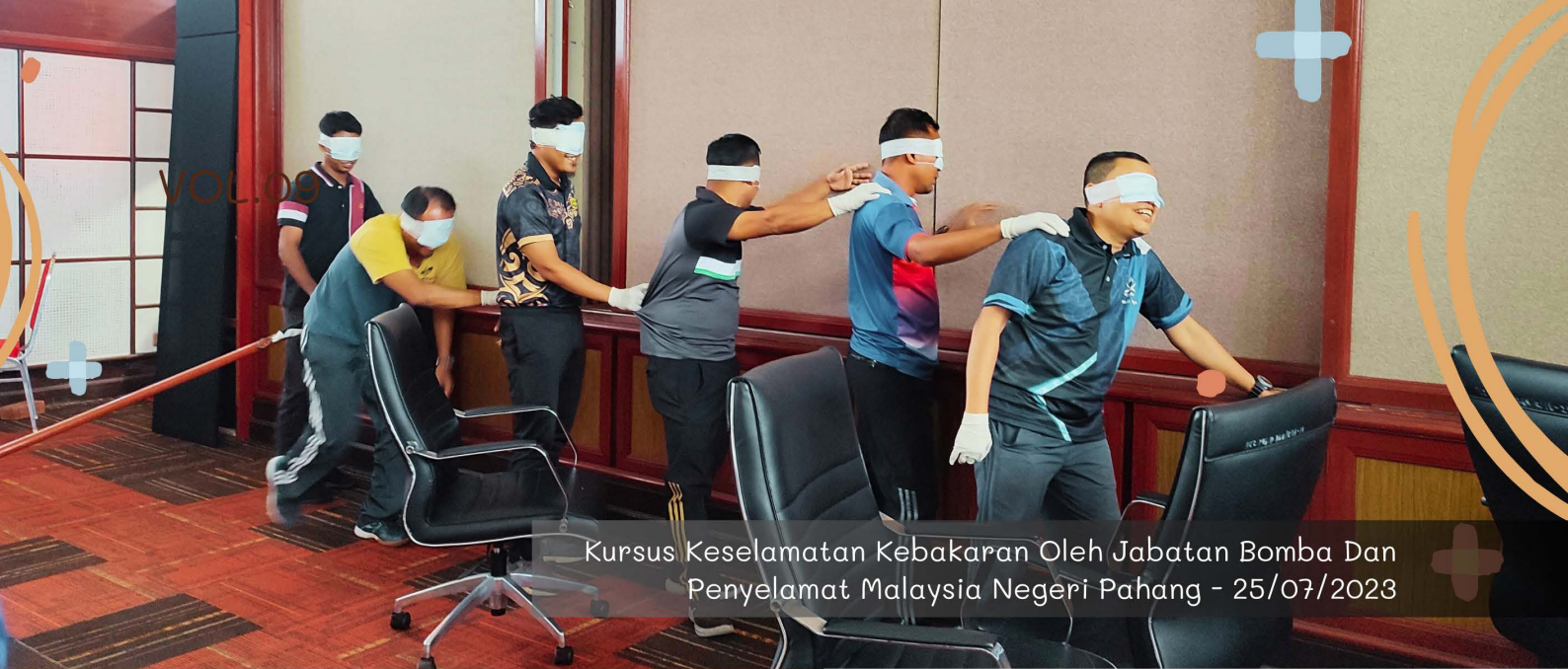
Kursus Keselamatan Kebakaran Oleh Jabatan Bomba Dan Penyelamat Malaysia Negeri Pahang - 25/07/2023